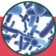
Probiotic 益生菌 | Probiotik