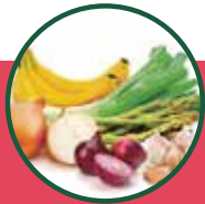
Prebiotic 益生元 | Prebiotik