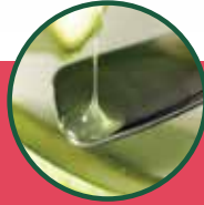
Aloe Vera Extract 芦荟精华 | Ekstrak Aloe Vera