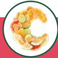
Vitamin C 维生素C | Vitamin C